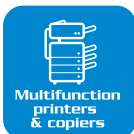
Multifunction printers & copiers